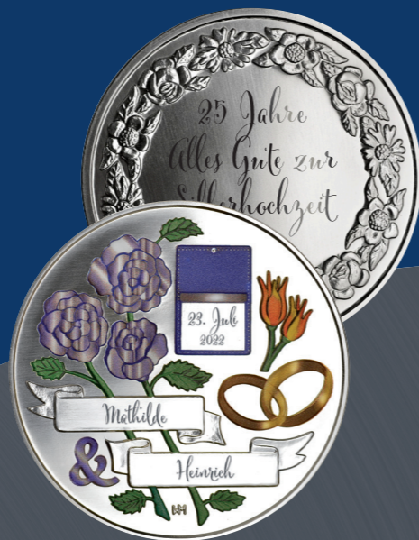
25 Jahre | Silberhochzeit