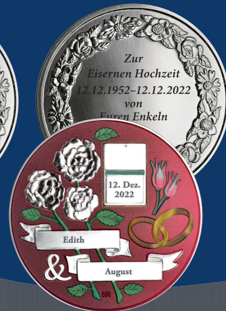
65 Jahre | Eiserne Hochzeit