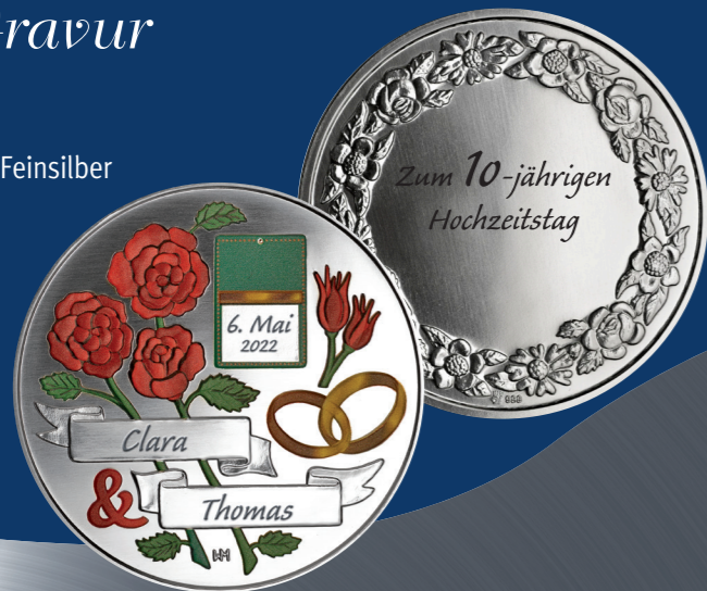
10 Jahre | Rosenhochzeit

Material | 999 Feinsilber Ø 50 mm Gewicht | 50 g