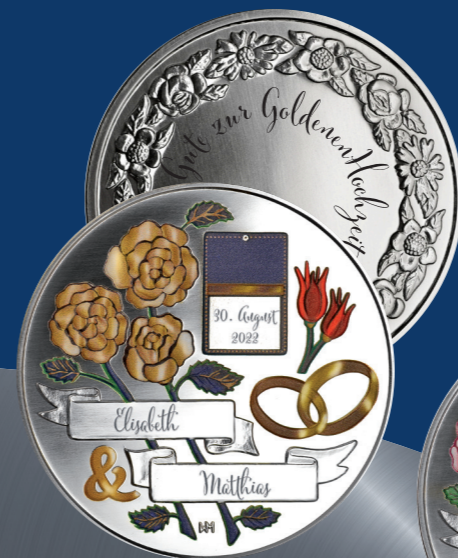
50 Jahre | Goldene Hochzeit