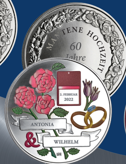
60 Jahre | Diamantene Hochzeit